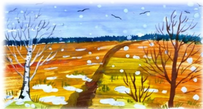
Ведь до поздней осени