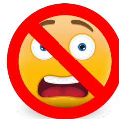
вовсе не боится.